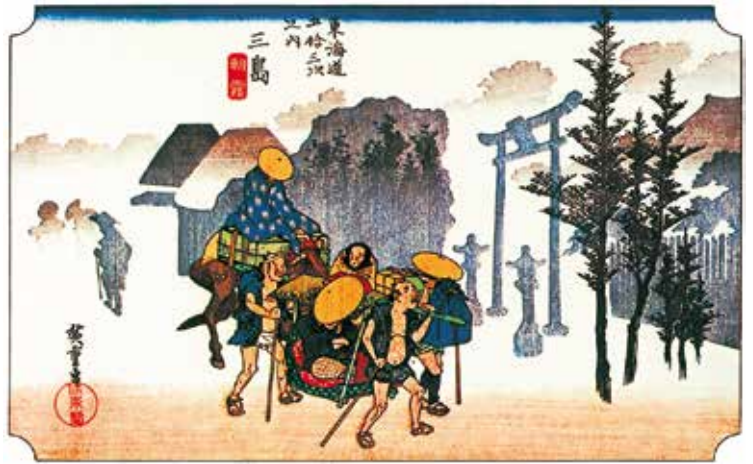
広重版画より 三島 朝霧