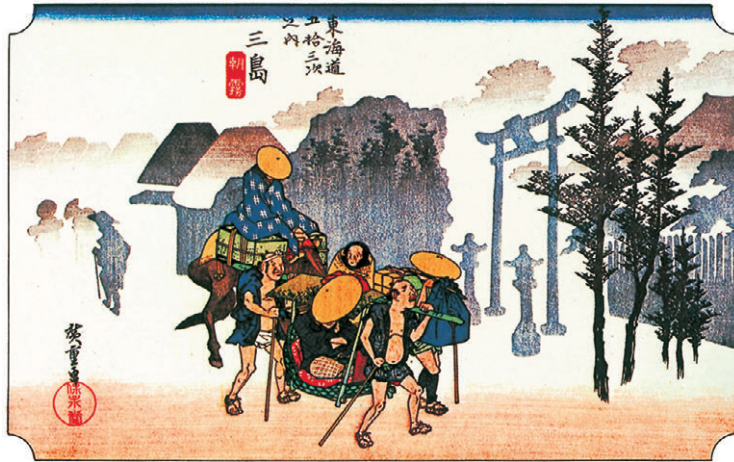
広重版画より 三島 朝霧