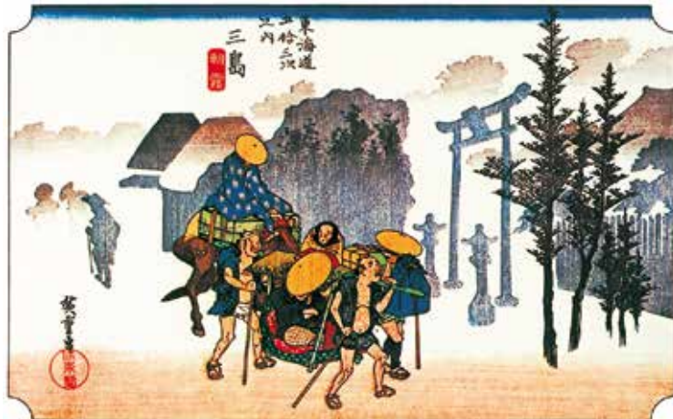
広重版画より 三島 朝霧