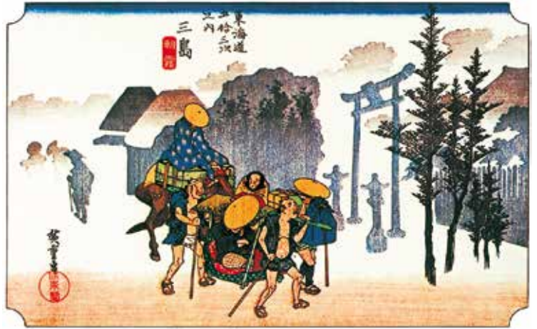
広重版画より 三島 朝霧