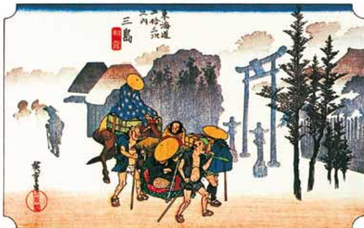
広重版画より 三島 朝霧