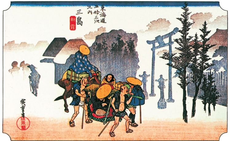
広重版画より 三島 朝霧