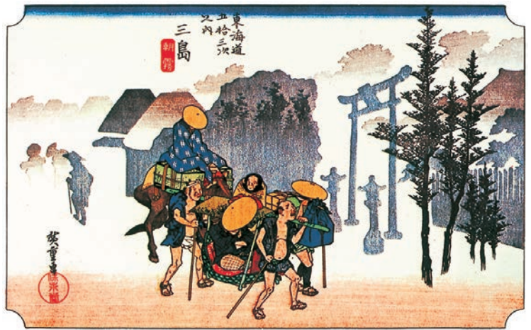
広重版画より 三島 朝霧