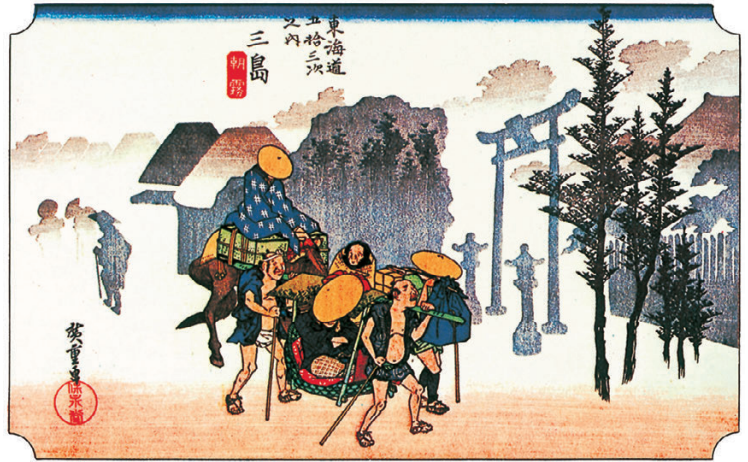
広重版画より 三島 朝霧