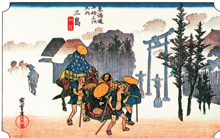
弘重版画より 三島 朝霧