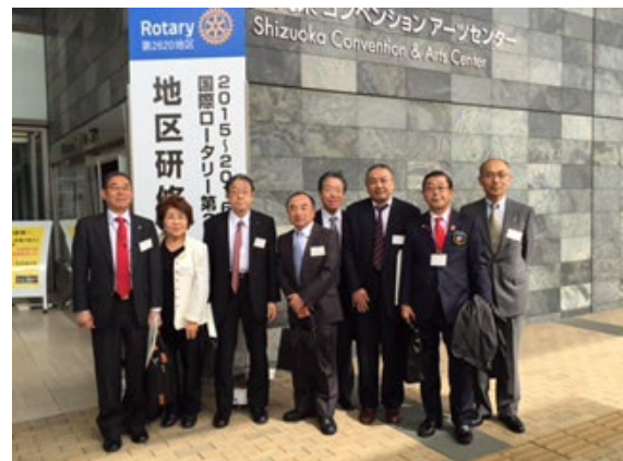
4月10日(日) 於:グランシップ