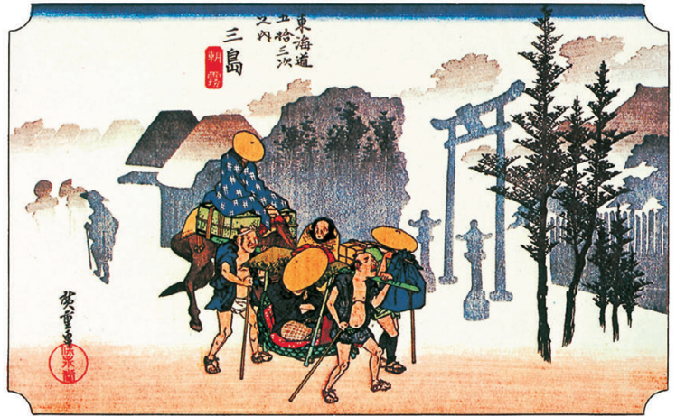
広重版画より 三島 朝霧