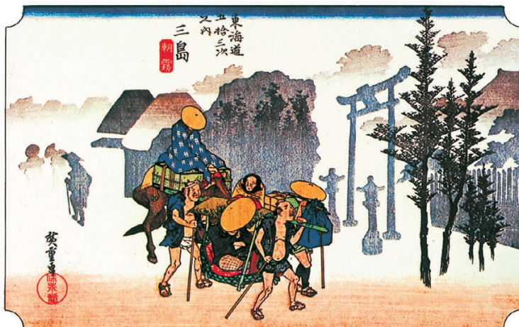
広重版画より 三島 朝霧