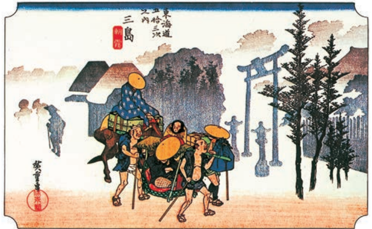
広重版画より 三島 朝霧