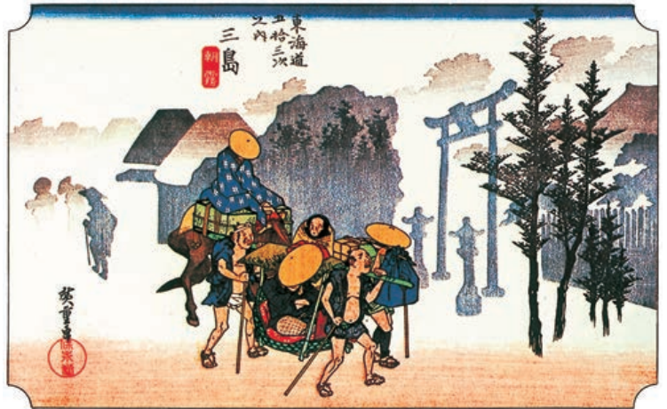
広重版画より 三島 朝霧