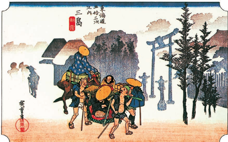
広重版画より 三島 朝霧