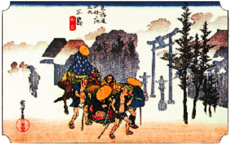
広重版画より 三島 朝霧