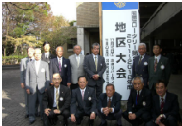
11月20日 地区大会 於：沼津