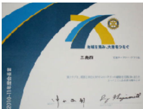
2010~11年度 特別会長賞受賞