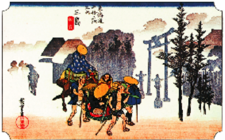
広重版画より 三島 朝霧