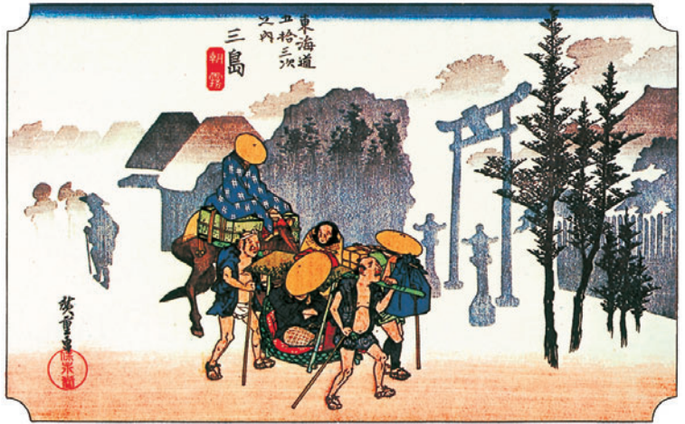
広重版画より 三島 朝霧