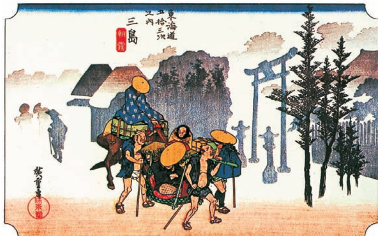
広重版画より 三島 朝霧