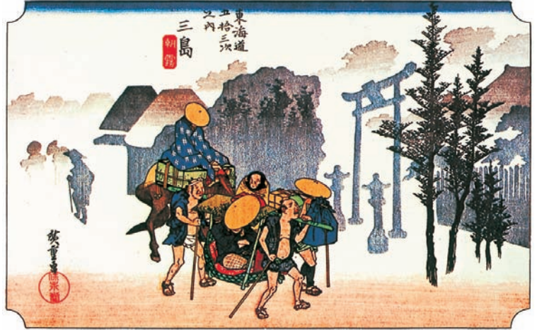
広重版画より 三島 朝霧