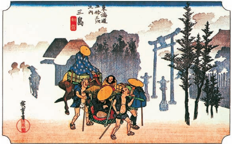
広重版画より 三島 朝霧